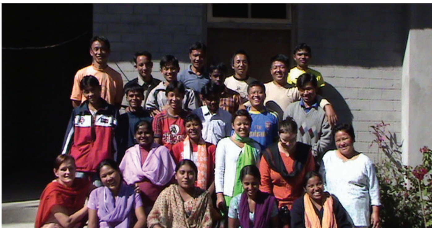
Bibelskole elever i Zoom; 2008-2009