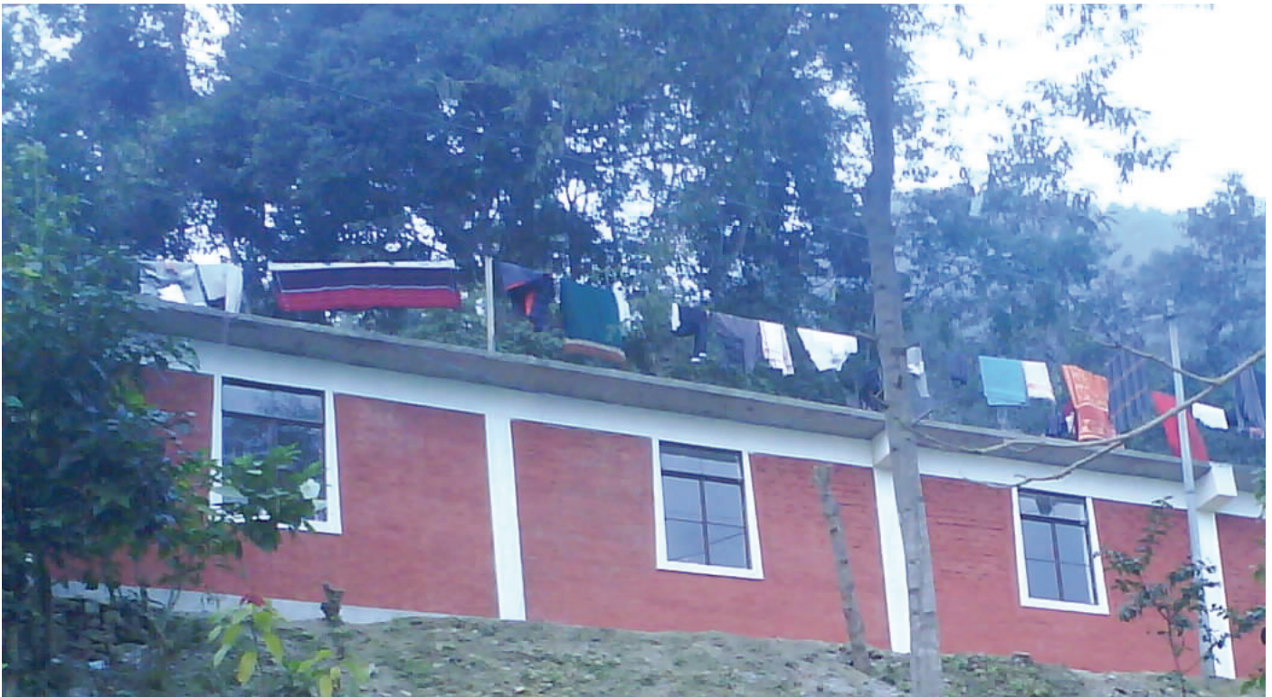
Bibelskolen i Zoom ligger oppe i fjellet, ovenfor Jorethang i Sikkim, India.

Vi gleder oss over å komme stadig videre med bibelskoler, og nedenfor ønsker jeg å begrunne hvorfor vi velger å vektlegge dette.