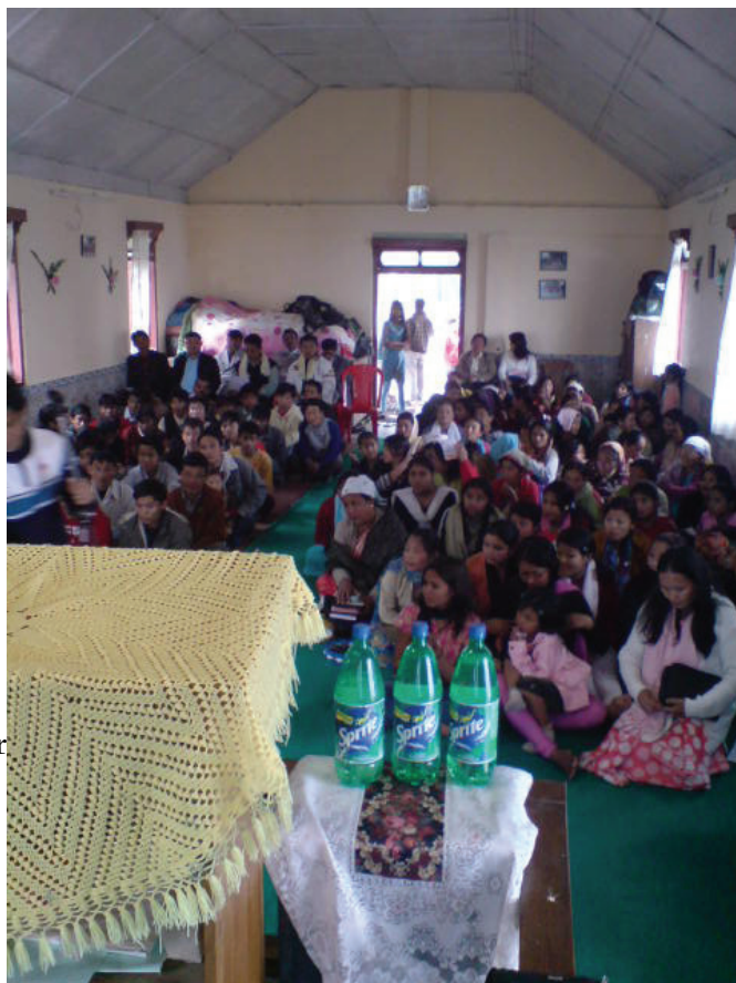
Forsamlingen under bibelskole avslutning i Latpanchor; januar 2009

En av de tingene vi ønsker, er også å lære folk å se etter behov for å fylle de. Kanskje den som ser et behov ikke er i stand til å fylle det selv, men da må han gi informasjon videre, så vi SAMMEN kan være med å fylle det. Vi troende bør alltid være bevisst på at vi jobber i team og vi har kanskje en med i teamet som kan gjøre det bedre enn oss selv. Da bør vi la vedkommende gjøre det.